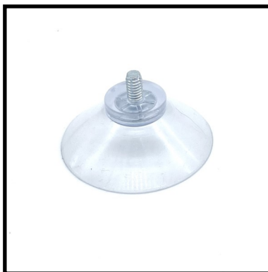
Haftsauger 38 mm ø , transparent mit Gewinde M4 x 6,5 mm lang Art-Nr. 01-370200-11 Verpackungseinheit: 100 Stück 49,90 € per 100 Stück