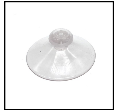
Haftsauger 40 mm ø , transparent mit Knopf-ø 15 mm, Hals-ø 10 mm Art-Nr. 01-341200-11 Verpackungseinheit: 100 Stück 19,95 € per 100 Stück