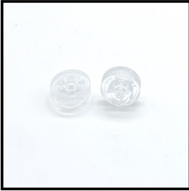
Rändelmutter - M4, transparent Art-Nr. 01-372200-11 Verpackungseinheit: 100 Stück 12,15 € per 100 Stück