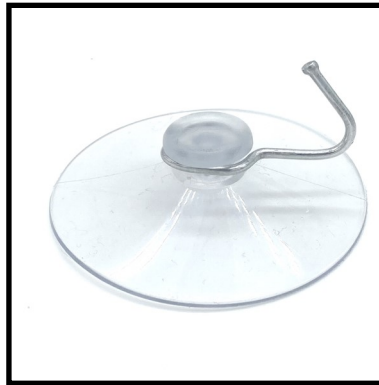
Haftsauger 60 mm ø , transparent mit Metallhaken Art-Nr. 01-360200-11 Verpackungseinheit: 100 Stück 40,20 € per 100 Stück