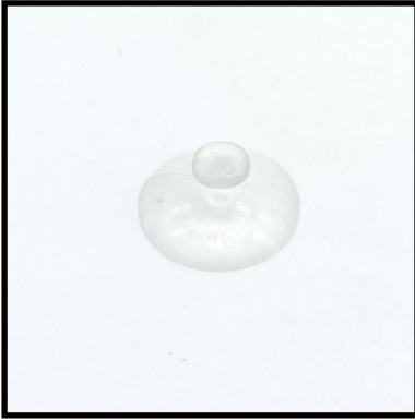
Haftsauger 20 mm ø , transparent mit Knopf-ø: 8 mm, Hals-ø: 4 mm Art-Nr. 01-321200-11 Verpackungseinheit: 100 Stück 11,90 € per 100 Stück