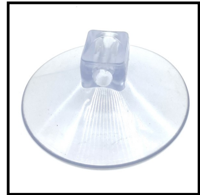
Haftsauger 60 mm ø , transparent mit Querloch 6 mm ø Art-Nr. 01-380600-11 Verpackungseinheit: 100 Stück 47,00 € per 100 Stück