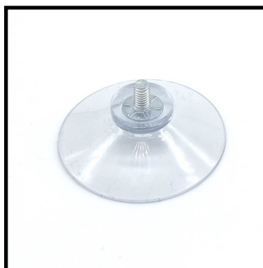
Haftsauger 40 mm ø , transparent mit Gewinde M4 x 6 mm lang Art-Nr. 01-370400-01 Verpackungseinheit: 100 Stück Preis: auf Anfrage