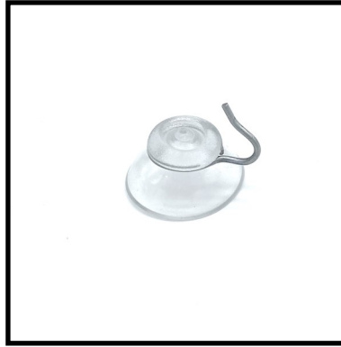
Haftsauger 20 mm ø , transparent mit Metallhaken Art-Nr. 01-320200-11 Verpackungseinheit: 100 Stück 15,90 € per 100 Stück