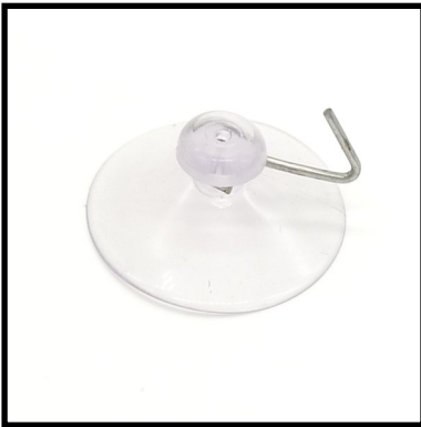
Haftsauger 40 mm ø , transparent mit Metallhaken Art-Nr. 01-340200-11 Verpackungseinheit: 100 Stück 23,95 € per 100 Stück